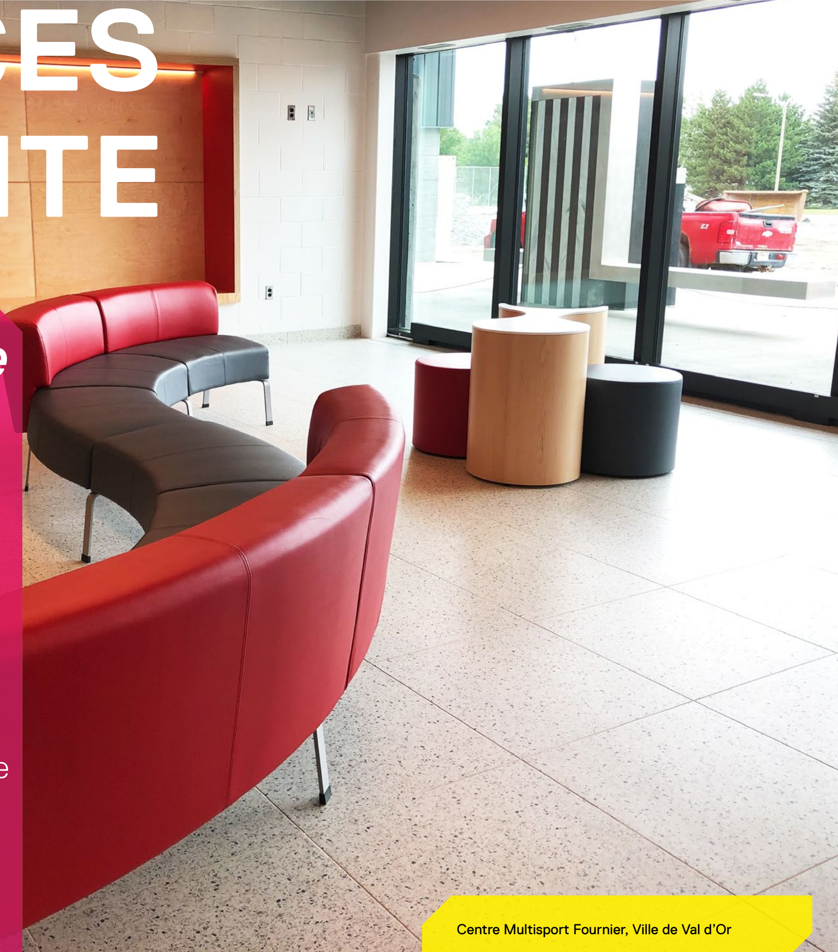
Centre Multisport Fournier, Ville de Val d'Or

Atmosphère vous offre des solutions de mobilier d'intérieur permettant d'aménager des espaces alliant design, fonctionnalité et confort de l'utilisateur. Vos aires d'attente et de détente auront tout pour plaire à votre public.