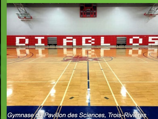
Gymnase du Pavillon des Sciences, Trois-Rivières

Nouvelle gamme Fitness Force par KOMPAN: Ces nouveaux équipements fonctionnent avec les mêmes mécanismes de biomécanique et de résistance que les machines de musculation en salle.