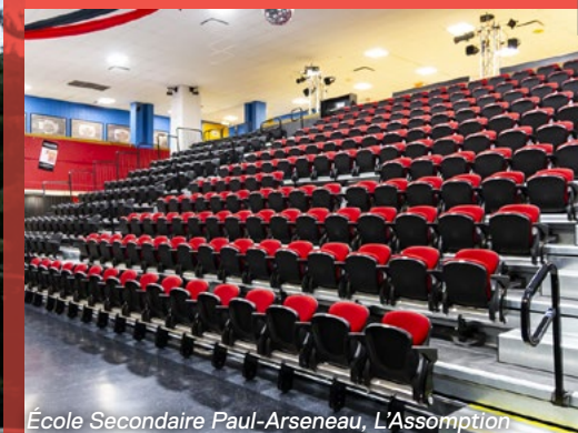
École Secondaire Paul-Arseneau, L'Assomption

La tribune télescopique MAXAM d'Hussey Seating maximisera certainement votre espace de gymnase.