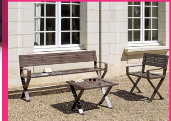
Aménagez votre terrasse avec style et élégance sans compromettre le confort et la durabilité avec la gamme Treccia par Concept Urbain.