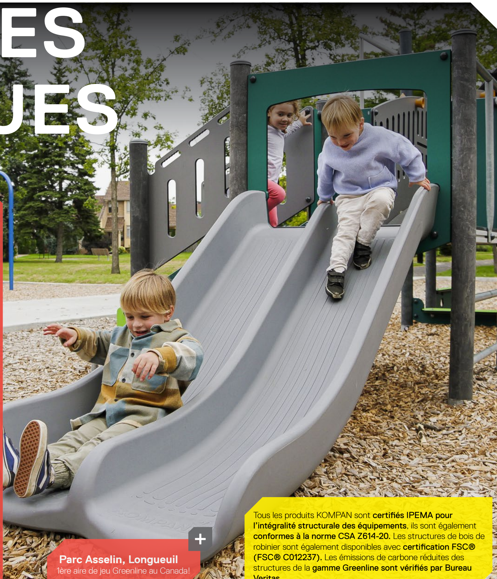
Parc Asselin, Longueuil 1ère aire de jeu Greenline au Canada!

Les aménagements ludiques sont depuis longtemps au cœur de notre projet d'entreprise. Nos spécialistes travaillent à la création d'espaces distinctifs qui permettent aux enfants de se développer et de s'épanouir dans un lieu unique et éco-responsable à faible émission de carbone.