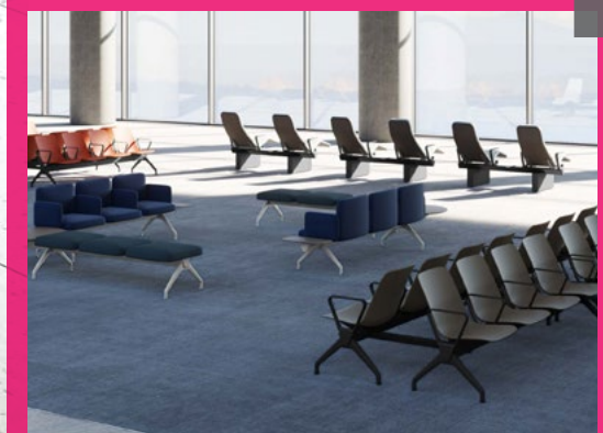
Avro par Arconas, un système polyvalent offrant une solution unique et flexible pour transformer n'importe quelle zone d'attente en salon VIP.