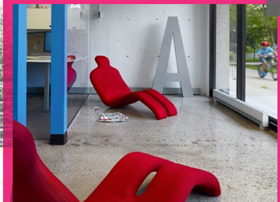
Le siège Bouloum est idéal dans une bibliothèque, une salle de rencontre ou un centre d'étude et de recherche.